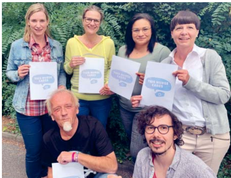
Die Pflegefachkräfte des KinderPalliativ-Teams Südhessen.

zugsweise ebenfalls durch sie (Deutsches Netzwerk Primary Nursing 2016).